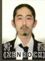
汁 婆 (ZENROCK)