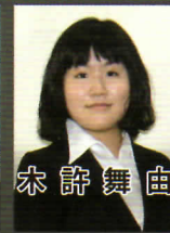
木 許 舞 由